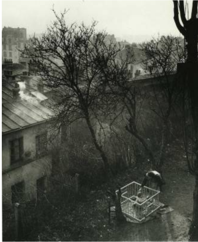
Dans une cour Rue Piat © Willy Ronis – 1948

Toutes les images visibles sur ce site le sont dans un but éducatif et de valorisation de l'artiste. Si celui-ci ou un ayant droit refuse de les y voir figurer , elles seront retirées sur simple demande