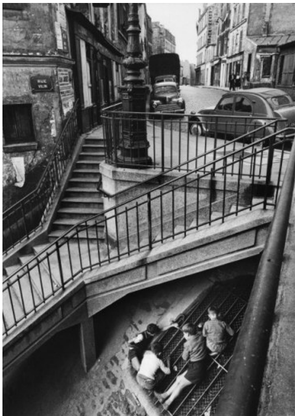
Au coin des rues Piat et Vilin, Paris, Belleville 1959