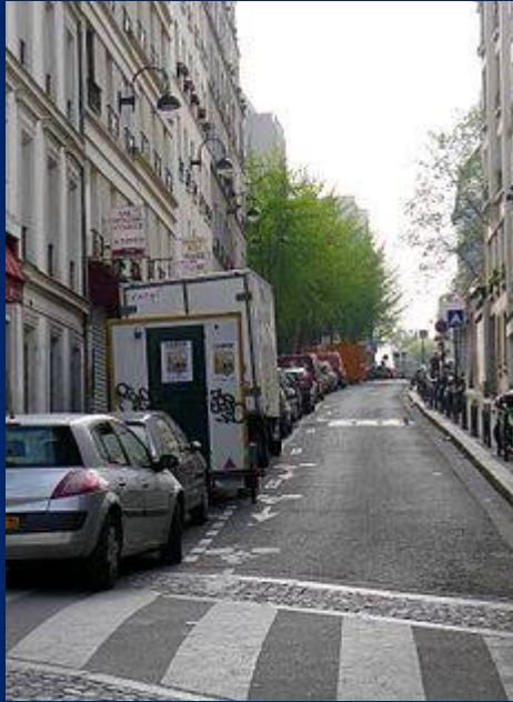
Rue Piat vue de la rue de Belleville .