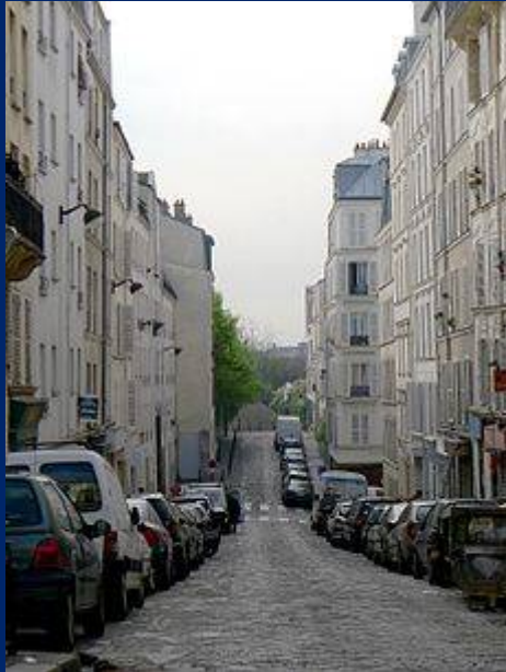
Rue Jouye-Rouve vue de la rue de Belleville .