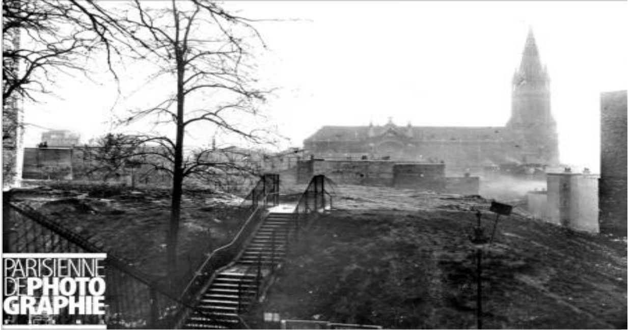
Paris (XXème arr.). La rue des Couronnes et l'église Notre-Dame-de-la-Croix à Belleville.