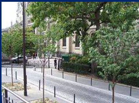
Vue de la place

Images et documents sur Wikimedia Commons