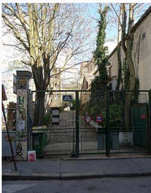
Vue de l'impasse